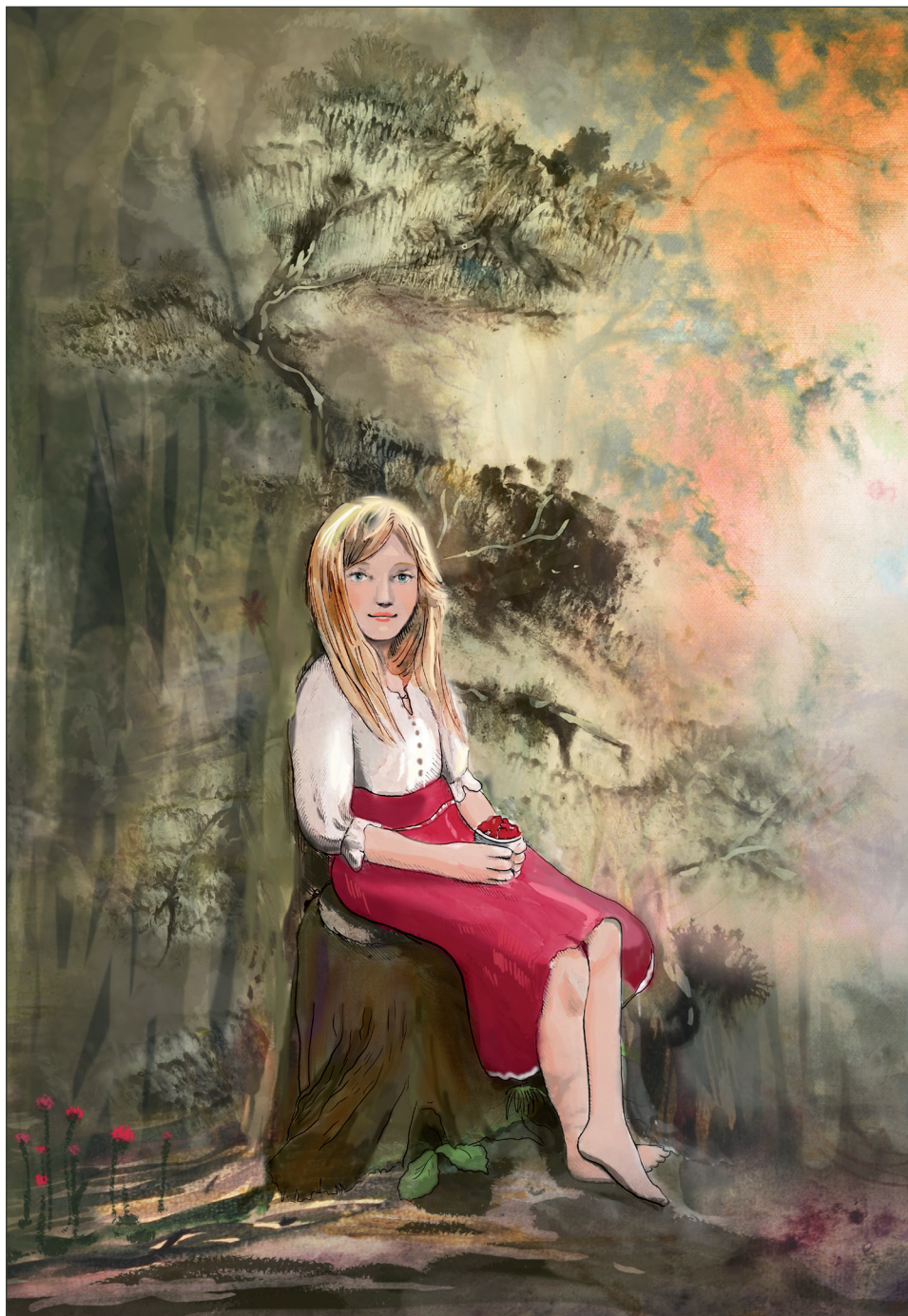
U cesty seděla dívka. V rukách držela hrníček, v němž byly nějaké červené plody.